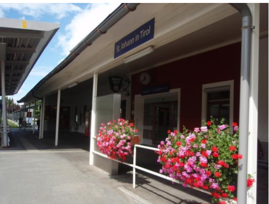
駅 St.Johann in Tirol